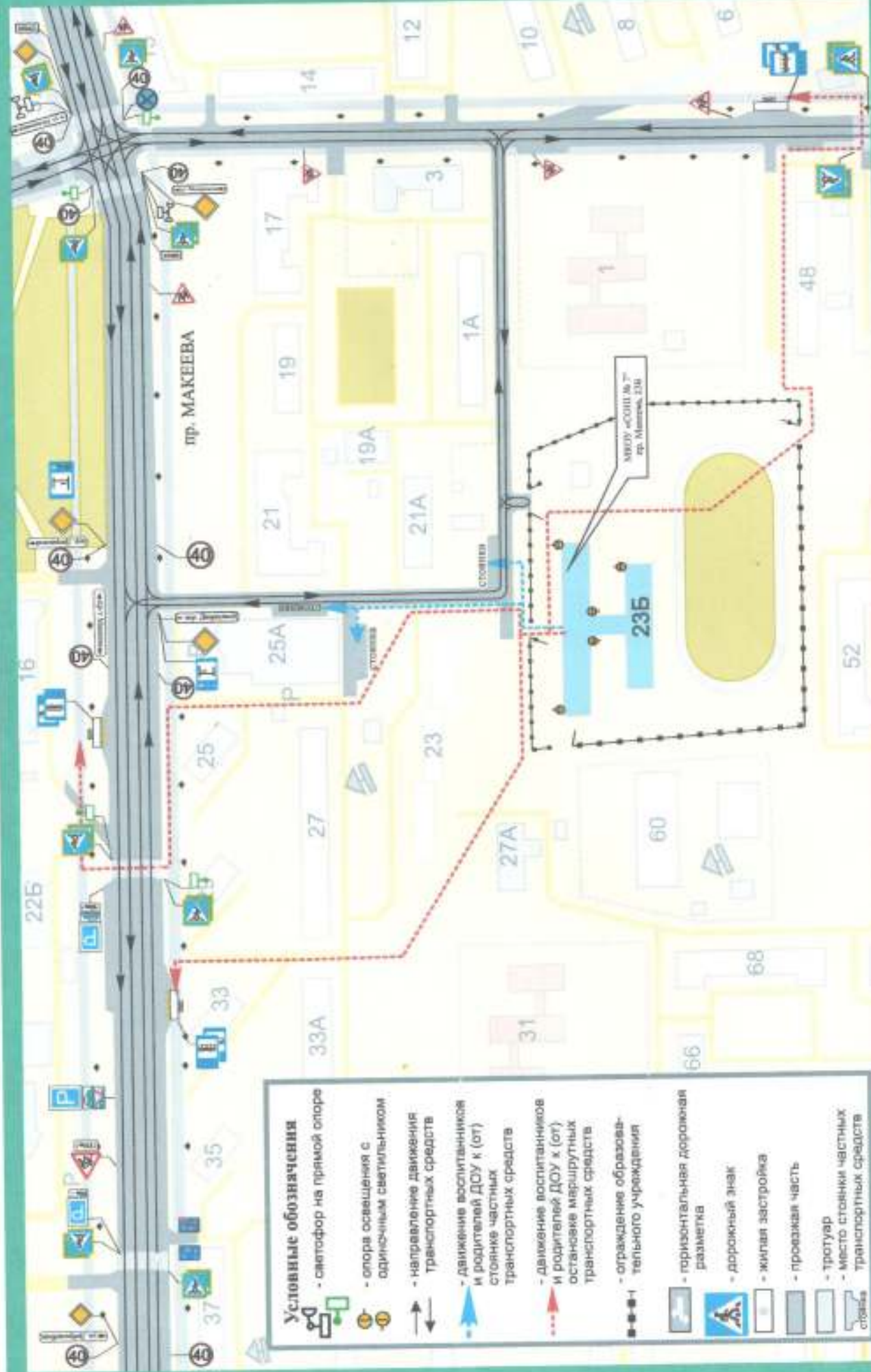
Схема организации дорожного движения, безопасные маршруты движения пешеходов и расположение парковочных мест в непосредственной близости от МКОУ «СОШ № 7»