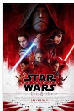
Звездные войны 8