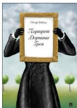
Портрет Дориана Грея