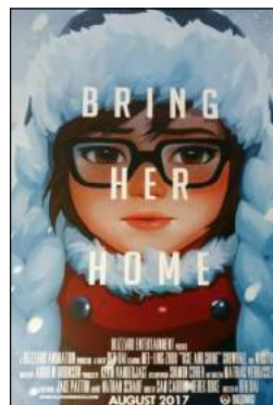
Проснись и пой