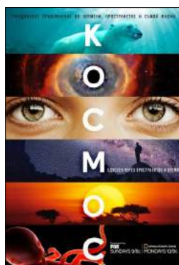
Космос: пространство и время